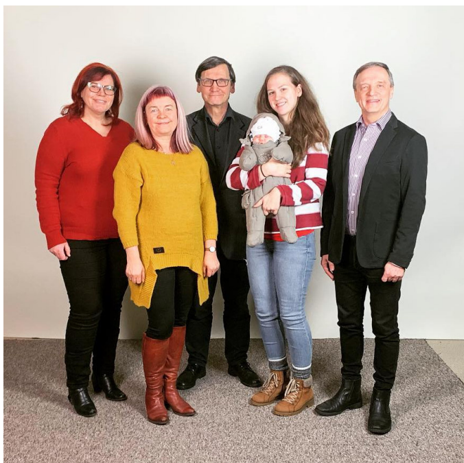
EKB Liidu arenguprojekti juhid koos Kehra Koguduse pastoriga.