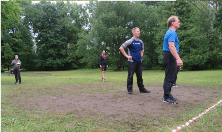
Kehra võistkond, kes saavutas võistlustel 2 väerika koha, palli ootamas!