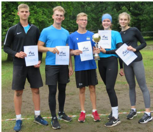
Võrkpall 2021 võitja võistkond nimega ELSA.