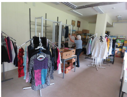
V-J viimane väljapanek