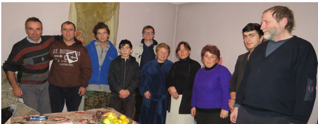
Pildil: Paguslaskülas kodugrupi kogunemisel

Selle töö toetamine võiks tulevikus olla üheks osaks Kehra Koguduse välismisjonis.