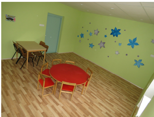
Pildil on pühapäevakooli klass